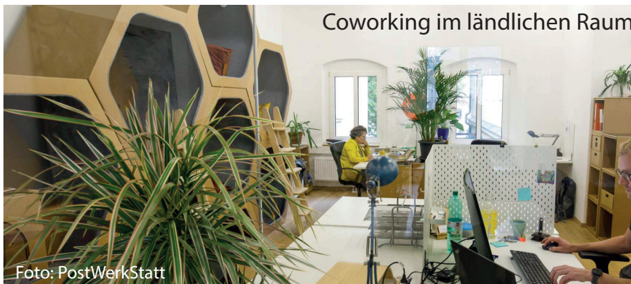
Coworking im ländlichen Raum