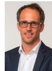
Vinzenz Mautner, Bürgermeister, SPÖ